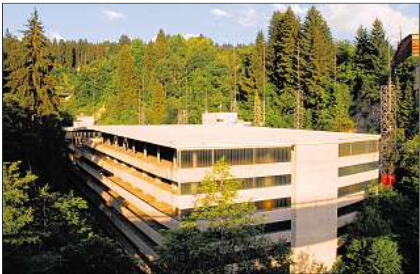
La casa da parcar vegn a restar el liug. Sin lezza vegnan duas casas cun 137 habitaziuns baghegiadas. Avon ston las autoritads denton s'occupar dils recuors ch'ei gest entrai.