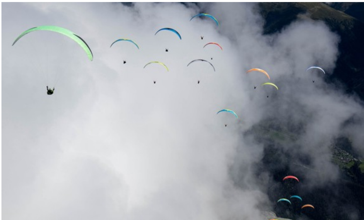
Impressionen von den Schweizer Meisterschaften der Gleitschirmflieger