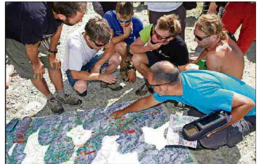
Schegie ch'els ein concurrents segidan ils pilots dallas differentas naziuns in l'auter ad anflar ina via optimala.