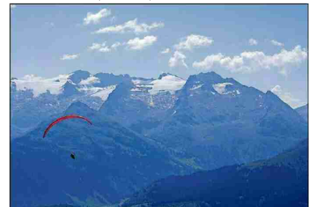
Ils pilots gaudan ina bellezia survesta.