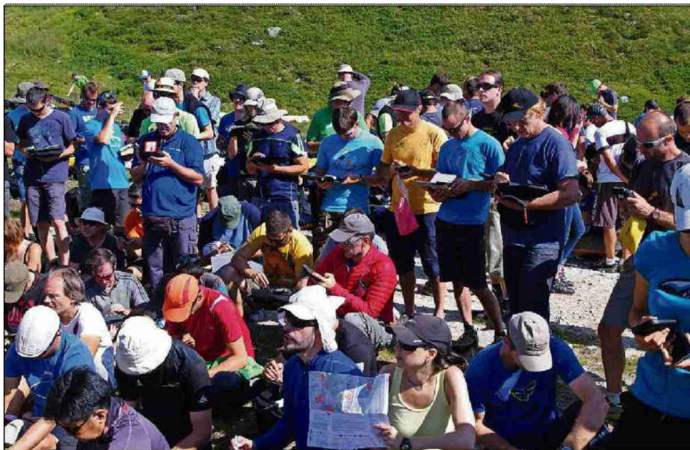
Cu las datas per la ruta ein publicadas endateschan ils pilots queellas en lur apparats.

Themen-Nr.: 048.002 Abo-Nr.: 1077450 Seite: 7 Fläche: 107'322 mm 2