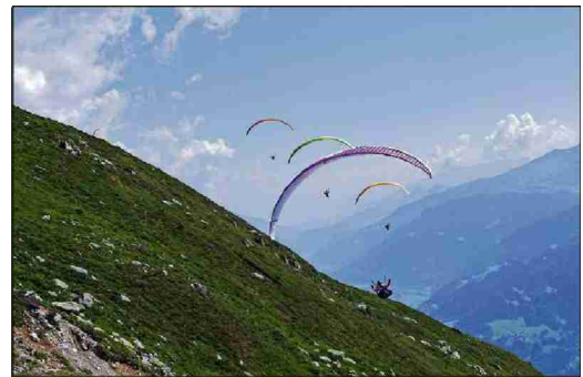
Quater pilots nezegian la termica dalla plaunca per gudignar altezza.