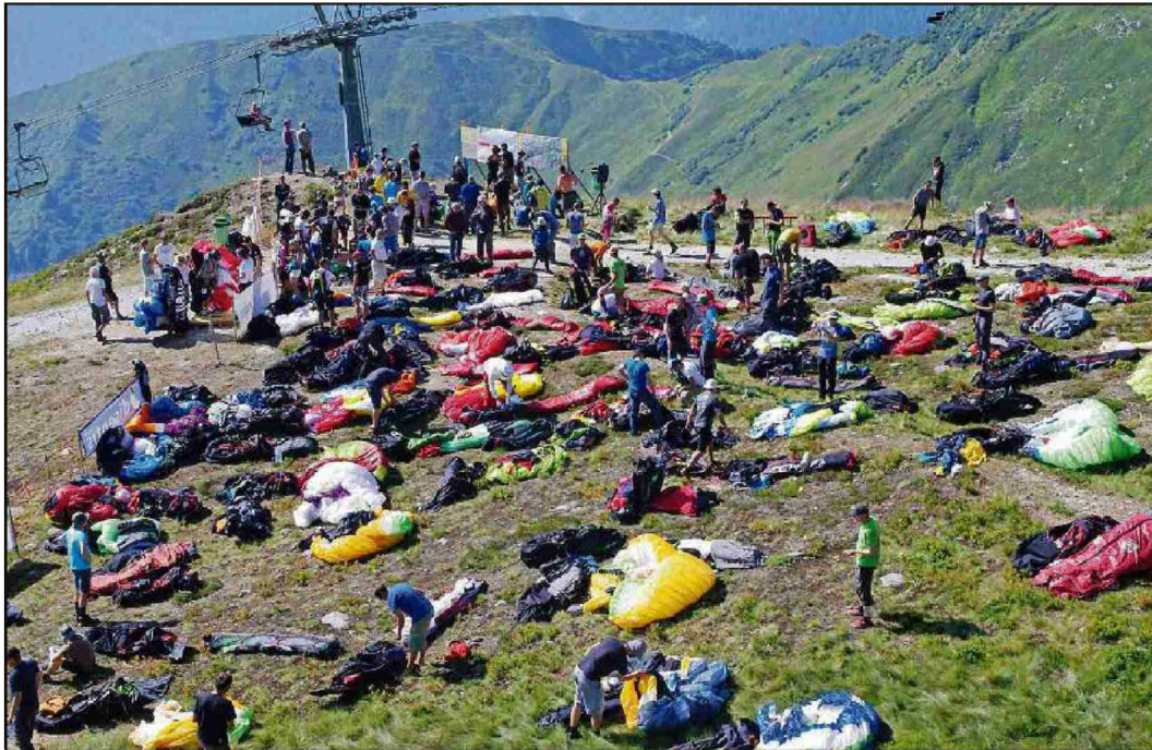
Ils pilots preparan lur parasguladers per la concorrenza.

Themen-Nr.: 048.002 Abo-Nr.: 1077450 Seite: 7 Fläche: 107'322 mm 2