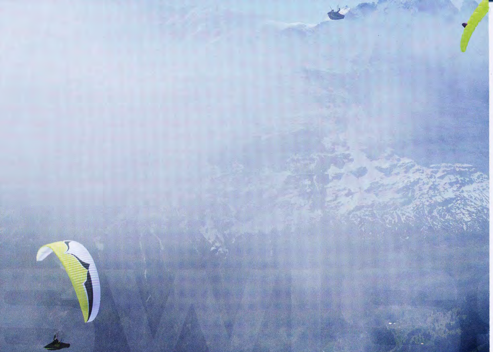
Wie oft in Grindelwald entstehen wegen verschiedener Luftmassen unterschiedliche Basishöhen (Andy Birenstihl). Comme souvent à Grindelwald, l'altitude de la base varie à cause de masses d'air différentes (Andy Birenstihl).