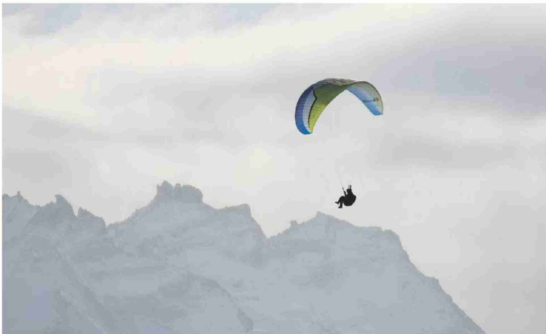
5000 Höhenmeter. An der Rollibocktrophy hatten die Teilnehmer einen harten Wettkampf vor sich.